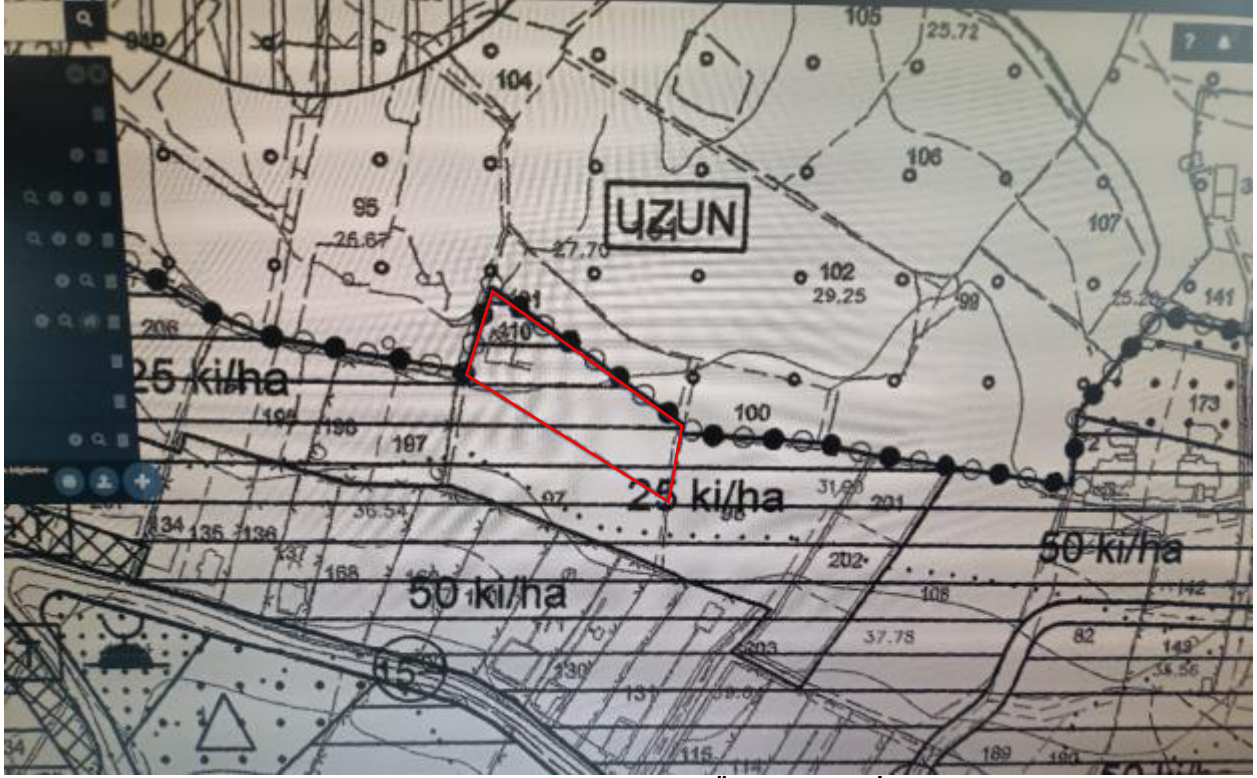
*Çatalca Belediyesinden alınan 1/5000 Ölçekli Nazım İmar Planı