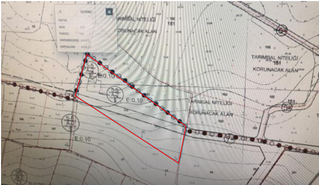
*Çatalca Belediyesinden alınan 1/1000 Ölçekli Uygulama İmar Planı